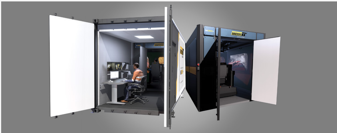
Simulator Bawah Tanah IM360+ yang Portabel dan untuk Penggunaan di Ruang Kelas

Immersive Technologies IM360+ akan diperkenalkan untuk pertama kalinya secara publik di MINExpo, bersama dengan inovasi sistem visual terbaru untuk memberikan nilai tambah bagi penambang bawah tanah. Solusi ini dirancang khusus untuk penambang bawah tanah, yang sering menghadapi kesulitan tertentu dalam pelatihan operator peralatan.