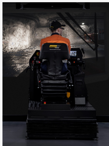
IM360+ dengan fitur 3D stereoskopik dan grafik foto-realistis untuk pertambangan bawah tanah

Dilengkapi dengan sistem visual terbaik di kelasnya, IM360+ adalah simulator pertambangan bawah tanah pertama yang menggabungkan 3D stereoskopik, grafis foto-realistis, dan teknologi pelacakan kepala RealView®. IM360+ memberikan realisme dan nilai pelatihan yang belum pernah dicapai di industri tambang bawah tanah. Platform ini membangun kesuksesan besar dari platform Immersive Technologies sebelumnya yang telah menjadi standar global dalam industri pertambangan selama 30 tahun terakhir, melatih lebih dari 250.000 operator peralatan tambang di 51 negara.