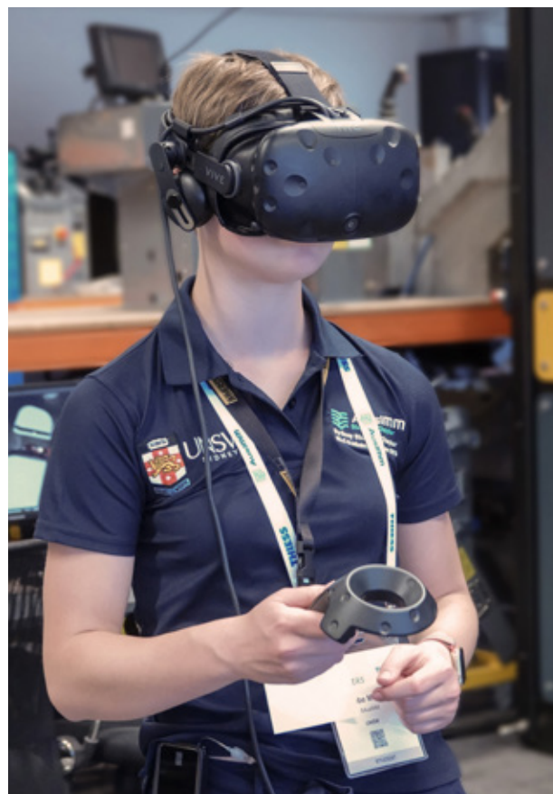
AusIMM - Participants à la conférence Nouveaux Leaders testant les simulateurs de pointe, l'apprentissage en ligne et des outils de RV d'Immersive Technologies.