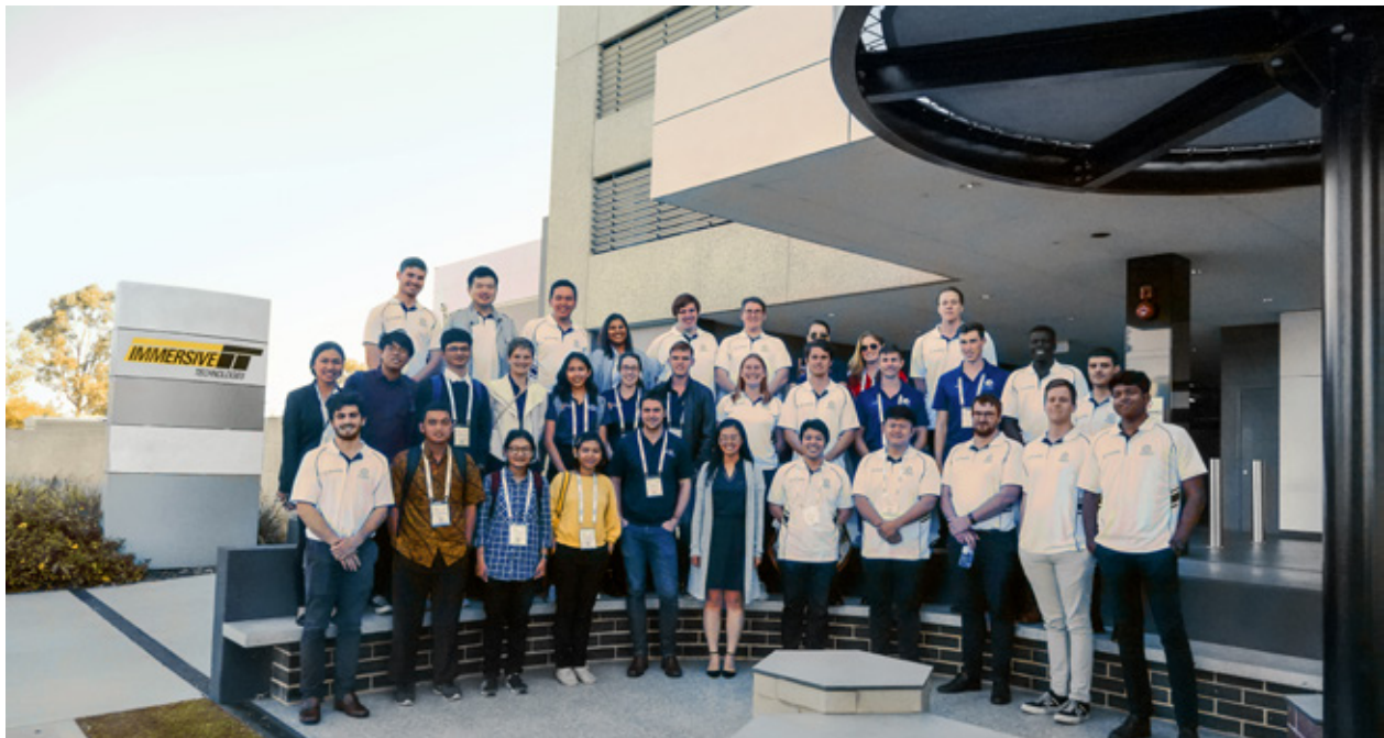
AusIMM - Participants à la conférence Nouveaux leaders de Perth.

À l'occasion de la première visite inaugurale du Centre d'expérience de Perth en Australie Occidentale, Immersive Technologies a accueilli plus de 35 jeunes professionnels et étudiants dans le cadre de la Conférence des nouveaux leaders organisée par l'Institut australasien des mines et de la métallurgie (AusIMM).