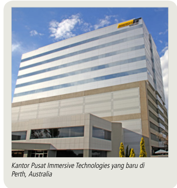
Kantor Pusat Immersive Technologies yang baru di Perth, Australia

Pengembangan dan penyempurnaan layanan tim ahli juga mencapai tingkat baru di tahun 2012 dengan bertambahnya jumlah investasi dan konsultan pelatihan serta teknisi untuk memenuhi permintaan tinggi atas Proyek Peningkatan Berkelanjutan (Continuous Improvement Project), Integrasi Sistem Pelatihan (Training Systems Integration), Penyesuaian Situs Tambang (Custom Mine Sites), dan Trainer Advantage TM yang memiliki lebih dari 1.200 pelatih bersertifikasi di seluruh dunia.