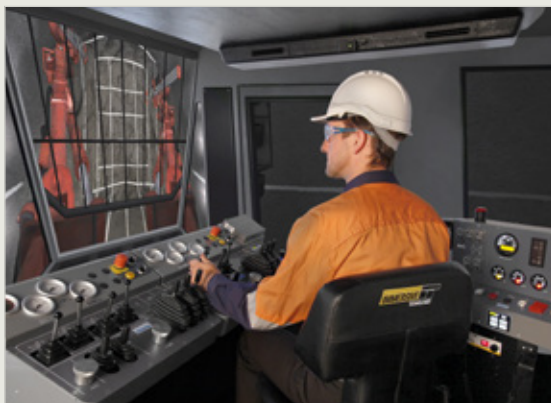
Conversion Kit® bor jumbo bawah tanah Sandvik DD420 yang belum lama diluncurkan