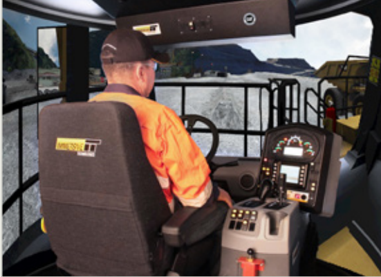
Conversion Kit® truk Caterpillar 795F-AC